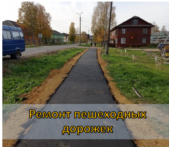
Ремонт пешеходных дорожек