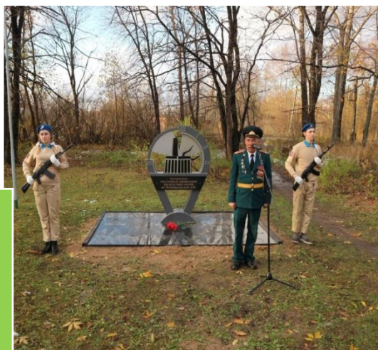
Памятник нашим землякам, принимавшим участие в ликвидации последствий аварии на Чернобыльской АЭС –